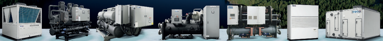
氣冷式冰水機系列